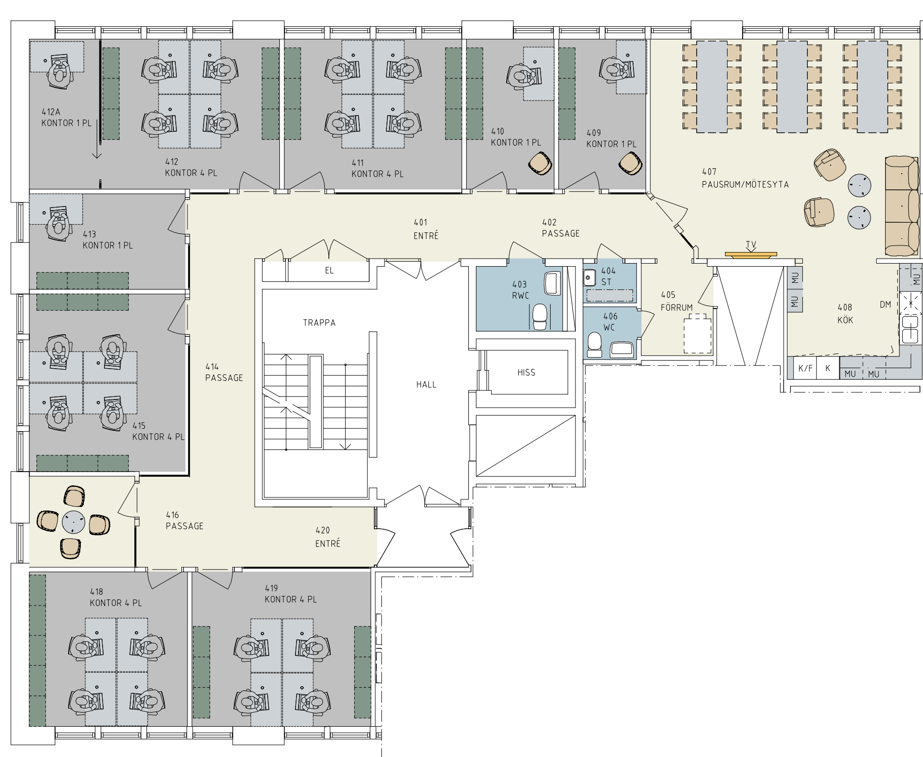
Plan 4, delplan