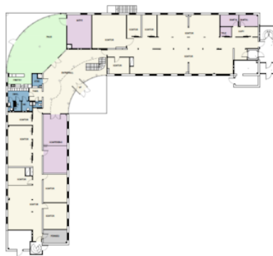
Plan 1, Entréplan