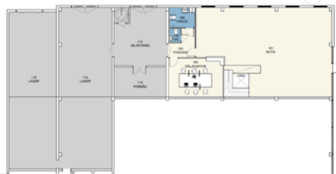
Plan 1, Entréplan

Kv. Råbyholm 4, Landsgränden 6, Lund Plan 1 och 2