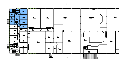
PLAN 2, 1TR

FÅR EJ BETRAKTAS SOM UPPMÄTNINGSRITNING DÅ DETALJMÄTNING EJ ÄR UTFÖRD. VISSA AVVIKELSER KAN FÖREKOMMA.