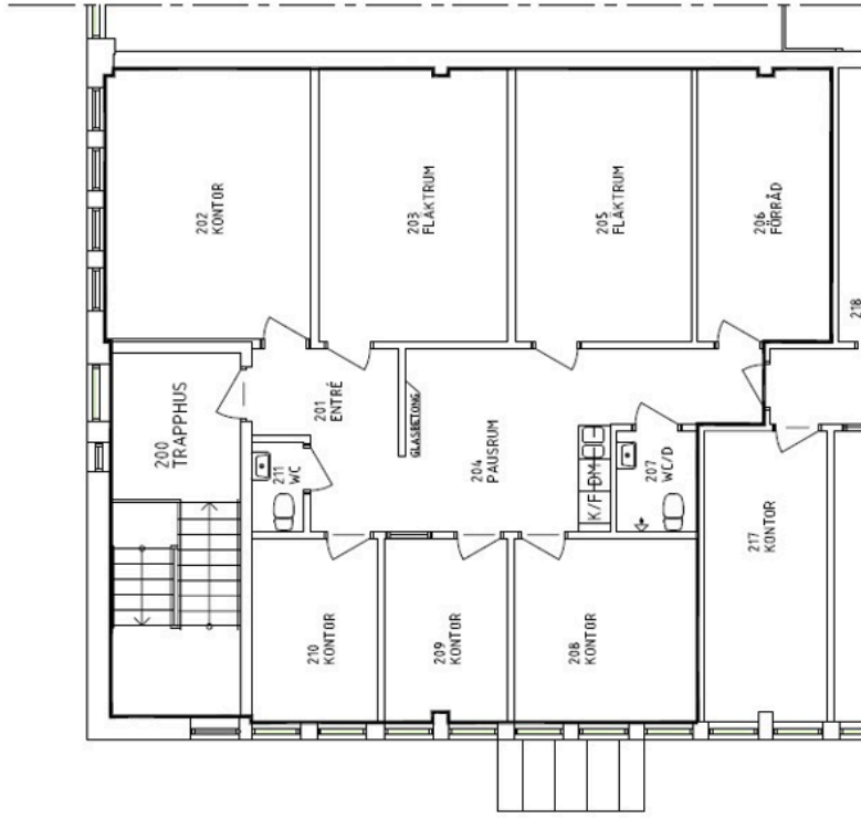
LOKAL 2D, PLAN 2 - HUS 5